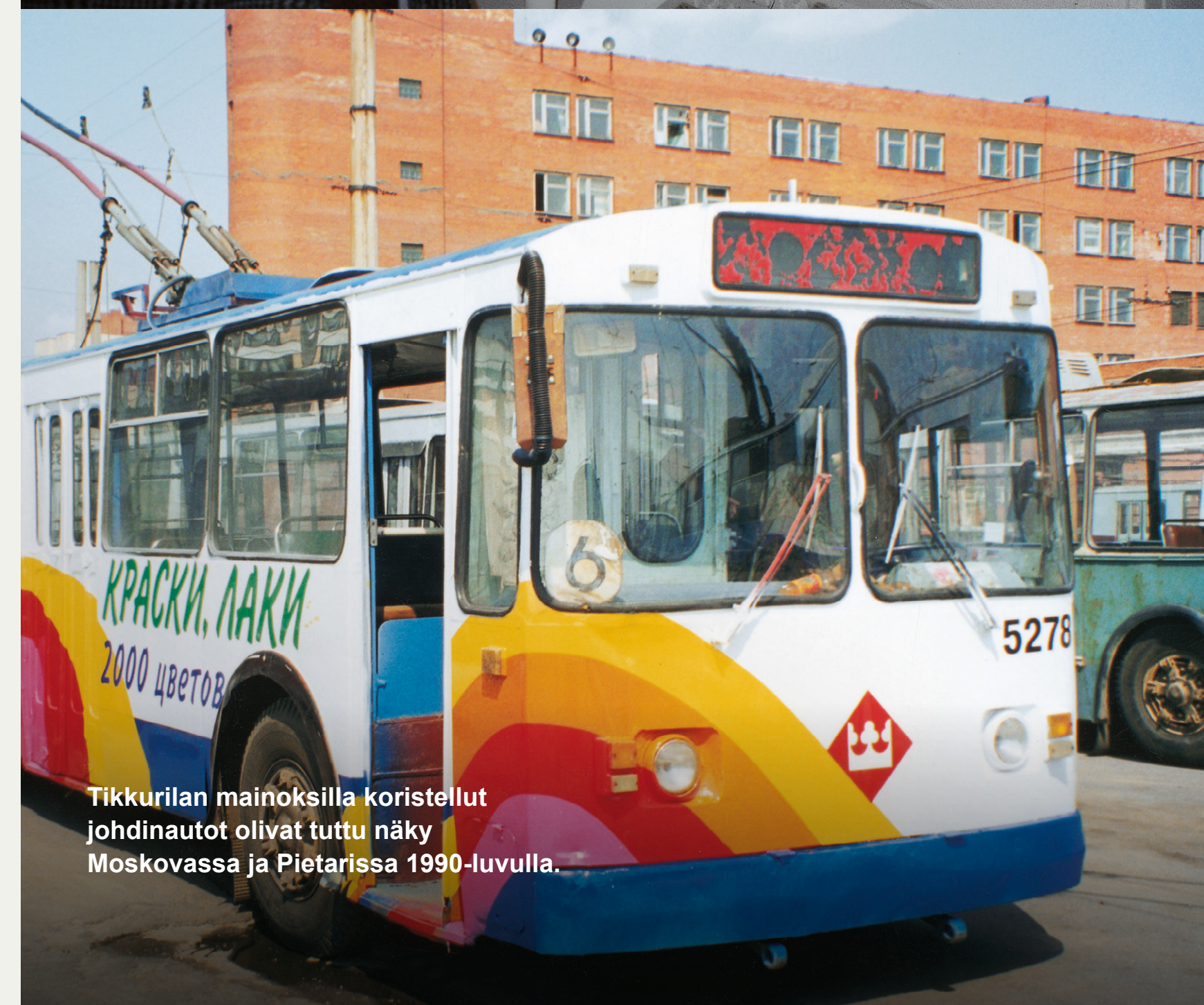
Tikkurilan mainoksilla koristellut johdinautot olivat tuttu näky Moskovassa ja Pietarissa 1990-luvulla.