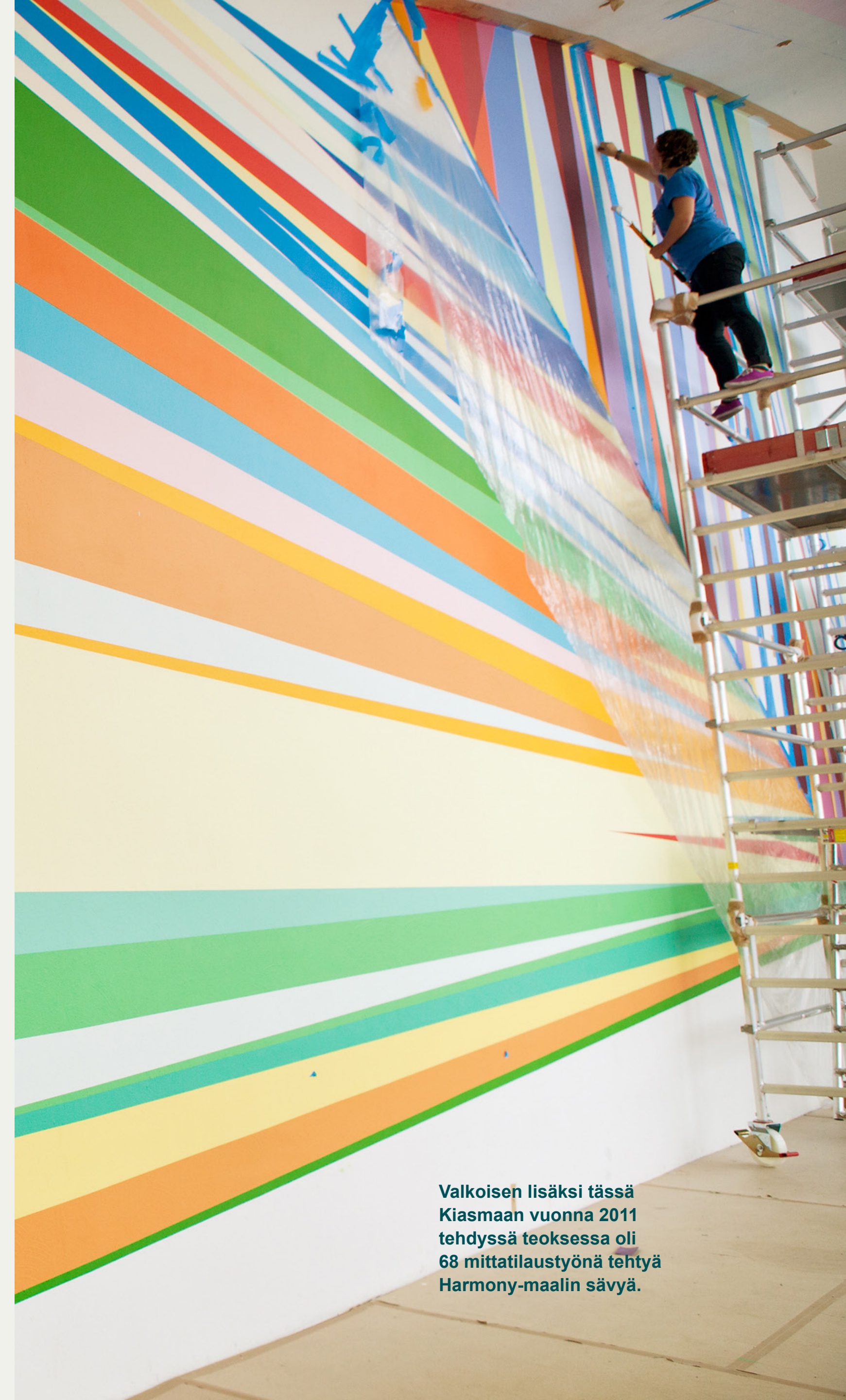
Valkoisen lisäksi tässä Kiasmaan vuonna 2011 tehdyssä teoksessa oli 68 mittatilaustyönä tehtyä Harmony-maalin sävyä.

Yhdysvaltalainen PPG osti Tikkurila Oyj:n kesäkuussa 2021, ja kaupankäynti Tikkurilan osakkeilla Nasdaq Helsingissä päättyi 29.10.2021.