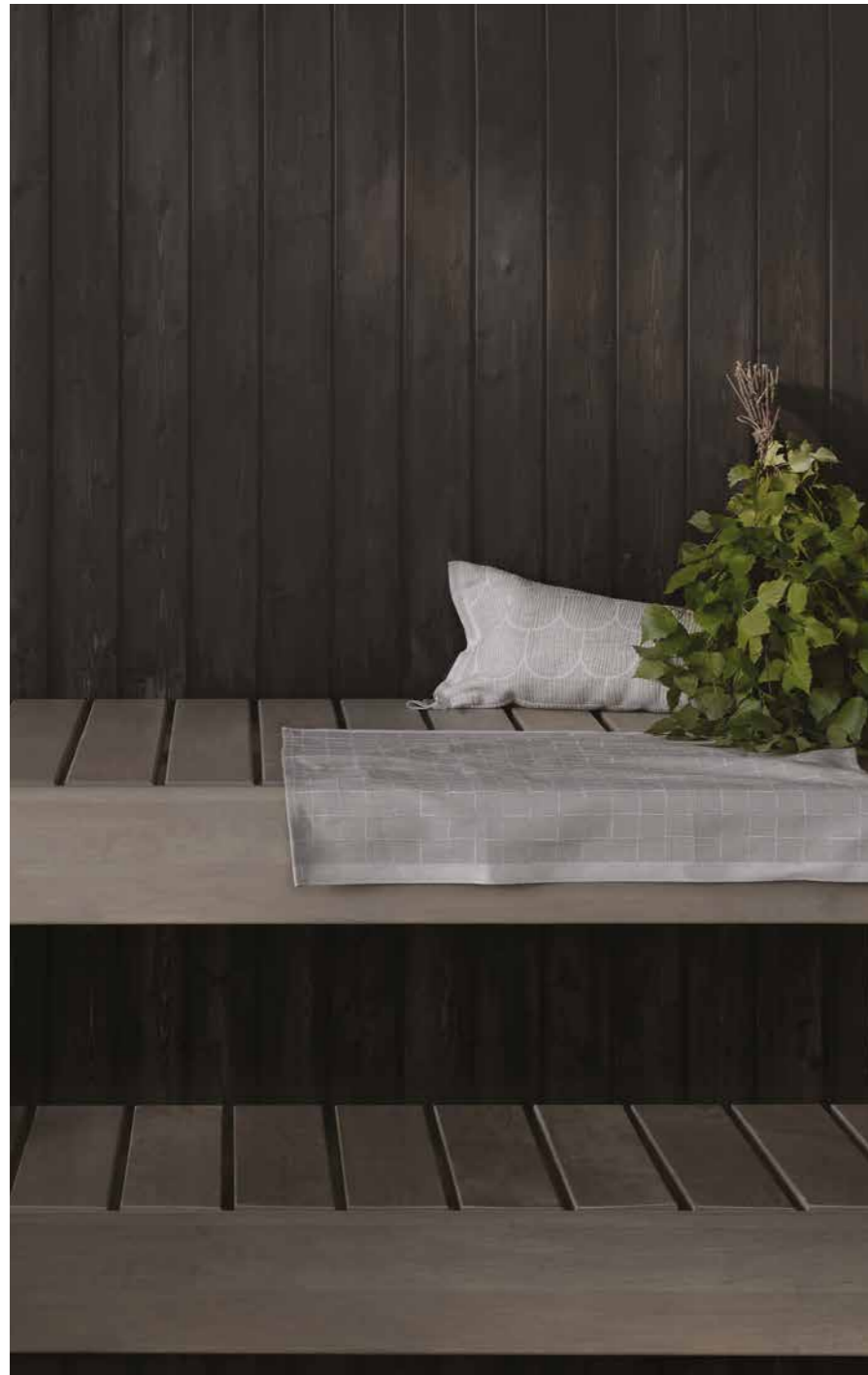
TUMMAT SÄVYT TUOVAT SAUNAN PEHMEYTTÄ JA TUNNELMAA.